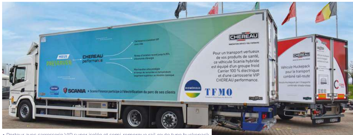
▲ Porteur avec carrosserie VIP super isolée et semi-remorque rail-route type huckpack.

En France, le parc de 30.900 semi-remorques frigorifiques avec groupe froid diesel émet chaque année 500.000 tonnes de CO 2 , rien que pour la production de froid.