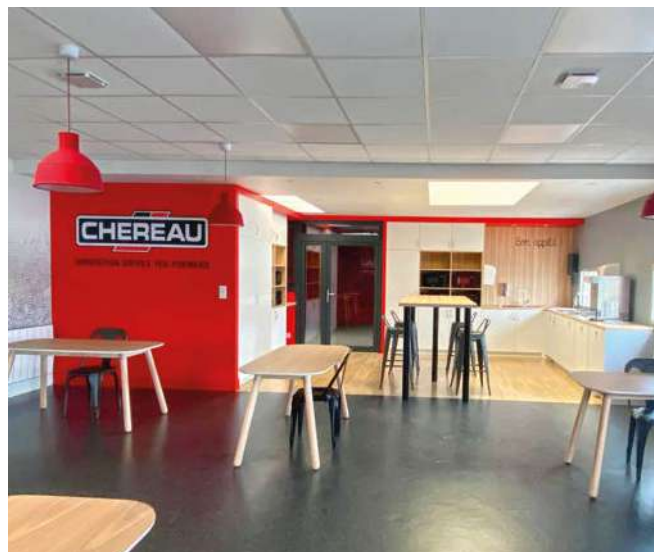
▲ Cette année encore de nombreux locaux ont été réaménagés pour le bien-être des collaborateurs.

« Au-delà d'avoir gagné la première édition de ce concours, nous sommes contents de pouvoir participer, à notre échelle, à la réduction des déchets parce que l'environnement est un sujet important pour tous. Ce concours est un bon moyen pour que l'ensemble des collaborateurs s'investissent. »