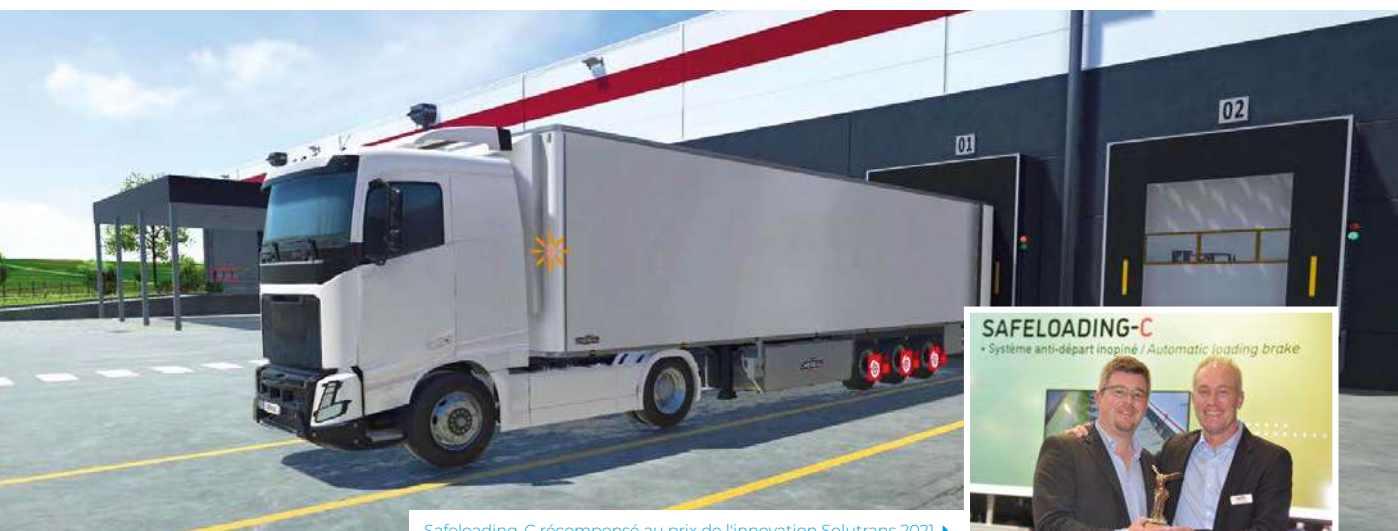
Safeloading-C récompensé au prix de l'innovation Solutrans 2021 ▶

Une innovation dédiée à la sécurité des opérateurs de quai qui chargent et déchargent les véhicules.