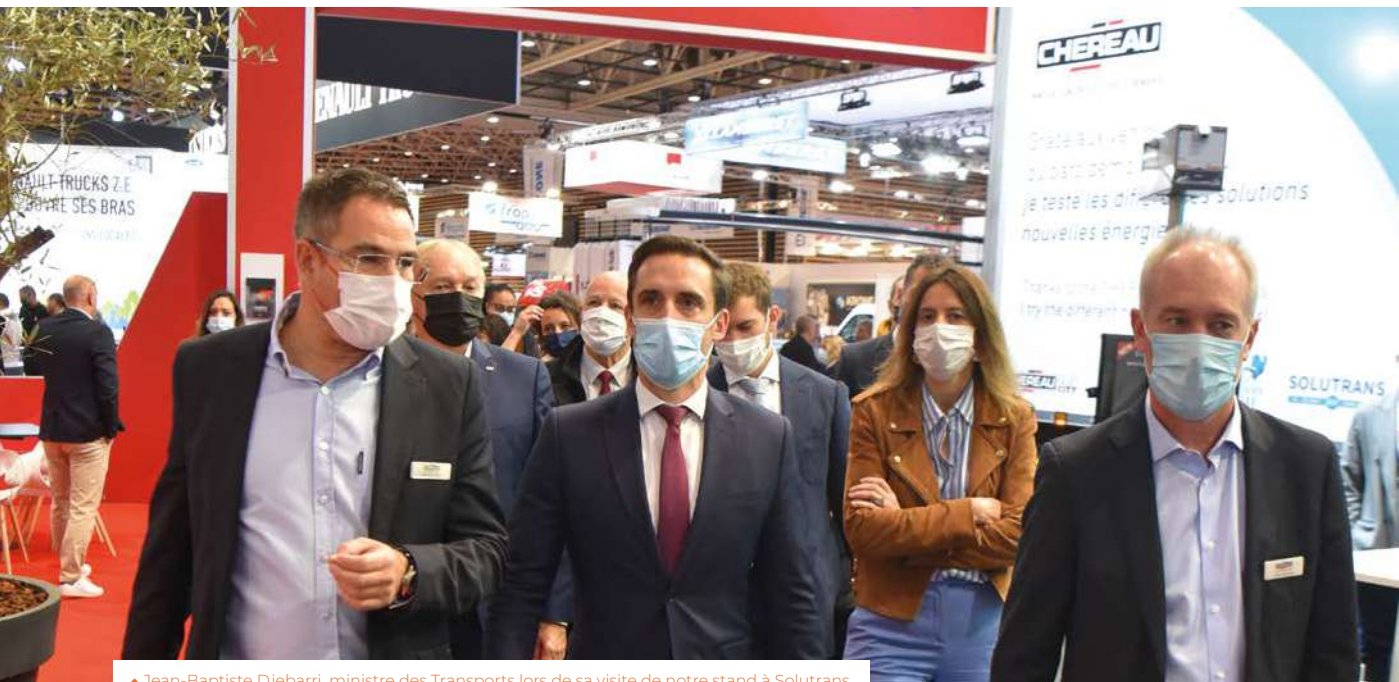
▲ Jean-Baptiste Djebarri, ministre des Transports lors de sa visite de notre stand à Solutrans.

Le contexte d'augmentation sans précédent des coûts des matières premières est venu profondément bousculer nos convictions et nos engagements.